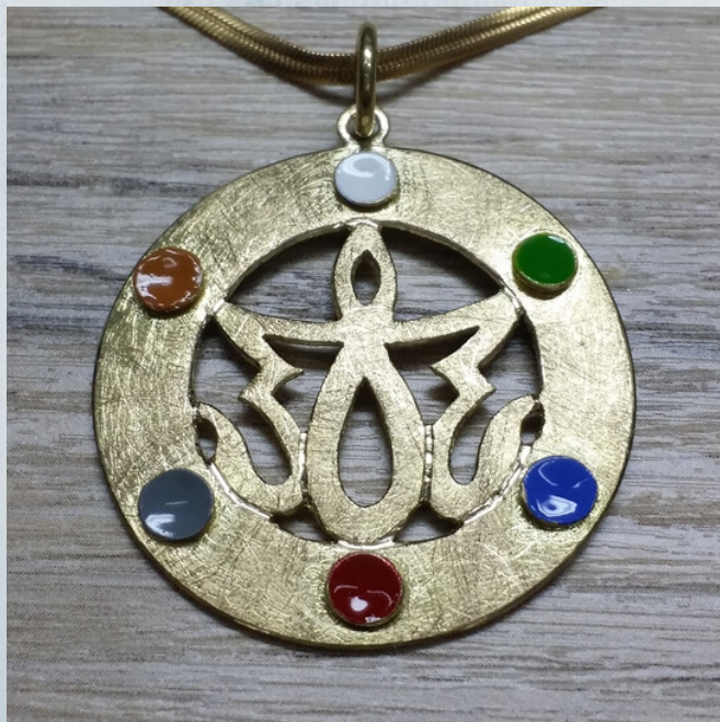
fig.3 Vista frontal. Personalizados nº2