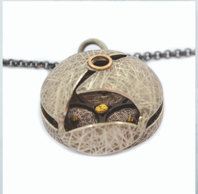
fig.24-Vista posterior. Personalizados nº12