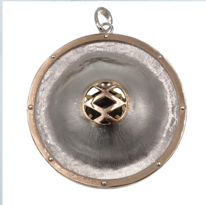
fig.11 Vista frontal. Personalizados nº6