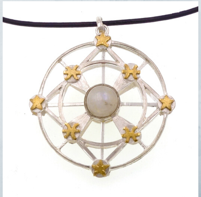
fig.16 Vista frontal. Personalizados nº8