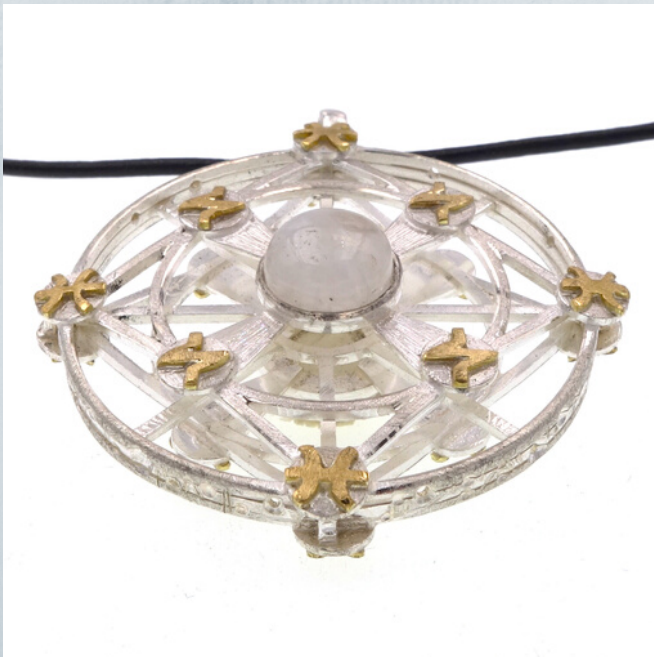
fig.15 Vista frontal. Personalizados nº8