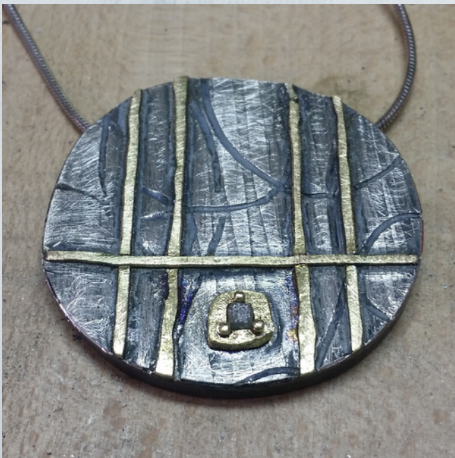
fig.19 Vista frontal. Personalizados nº10