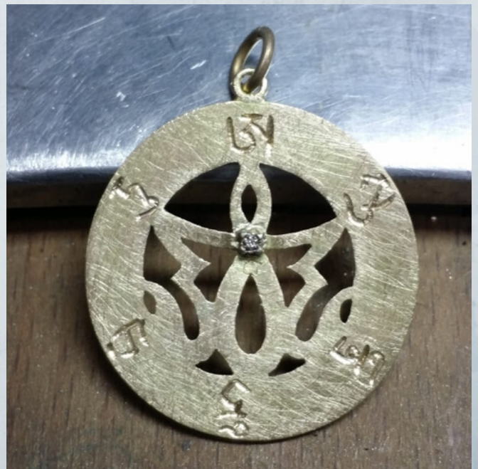
fig.4 Vista posterior. Personalizados nº2