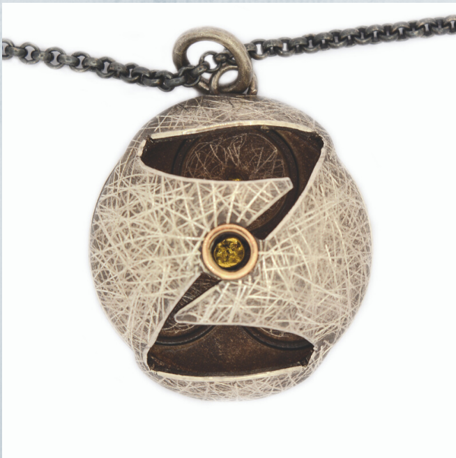
fig.23 Vista frontal. Personalizados nº12