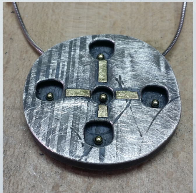
fig.20 Vista posterior. Personalizados nº10