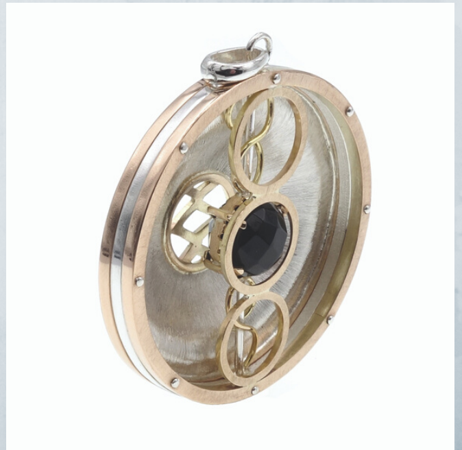
fig.12 Vista posterior. Personalizados nº6